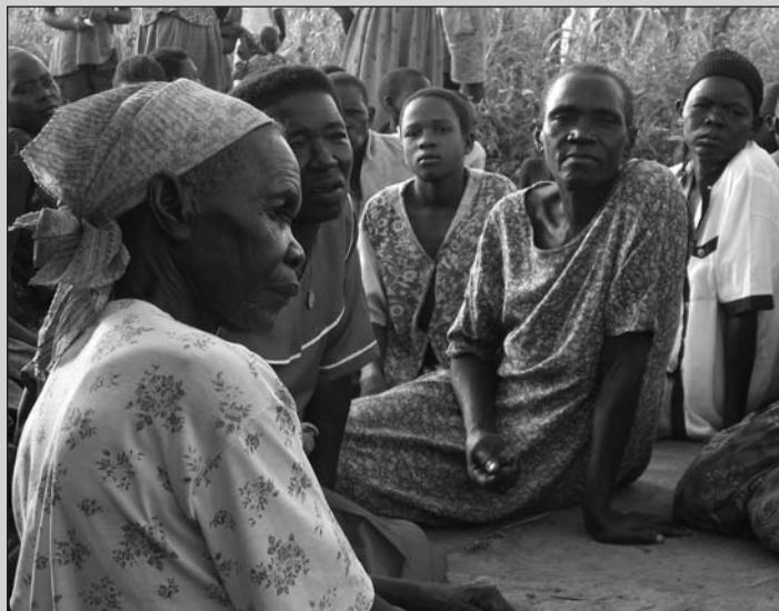
De l'autre côté du pays

terminé. Par le biais des paroles de Jackson le chauffeur et d'un animateur radio en voix off , la cinéaste dénonce et accuse les principaux responsables de la souffrance des personnages, en prenant garde toutefois que son film ne glisse pas vers la facilité du documentaire-choc. ■