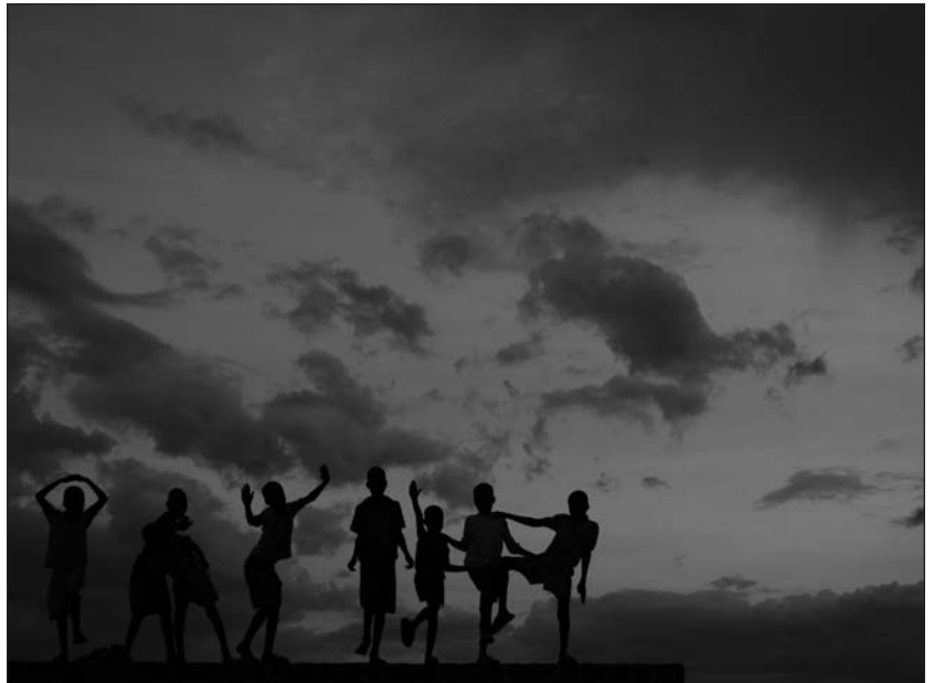
Jeunes Ougandais

J'ai découvert ces émissions sur Internet, une fois de retour à Montréal. Évidemment, pendant mon séjour en Ouganda, cet animateur n'était déjà plus sur les ondes et je crois qu'il est maintenant en exil. Nous avons contacté la station de radio pour savoir