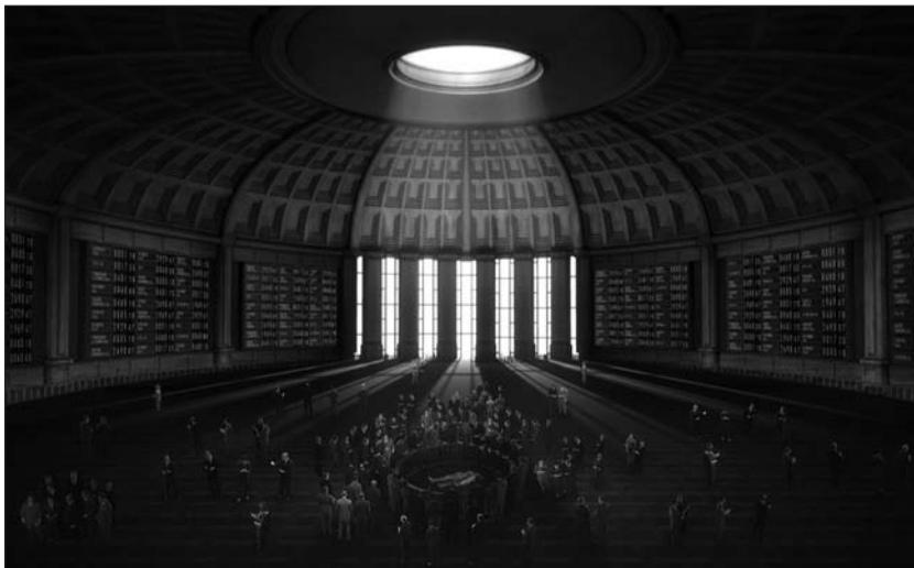
Images de la mine et de la Bourse dans Un capitalisme sentimental

noirs américains. On y retrouve aussi une touche d'expressionnisme allemand, surtout dans la seconde moitié. Comment avez-vous réussi à intégrer toutes ces références dans un seul scénario?