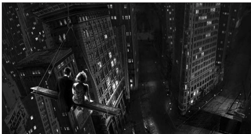
Planche du story-board et image du film Un capitalisme sentimental