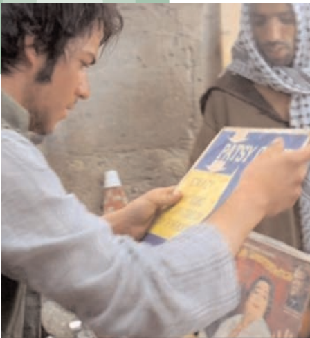
Zach fait tout une découverte à Jérusalem