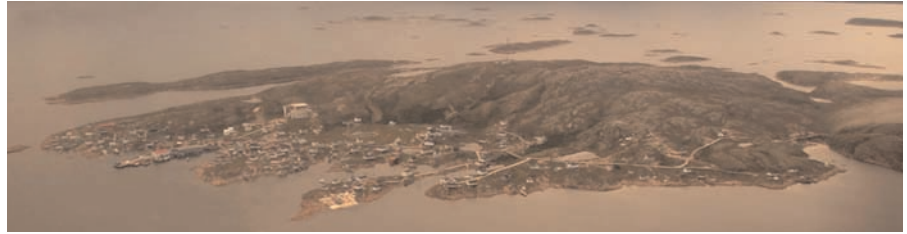
Vue aérienne du village