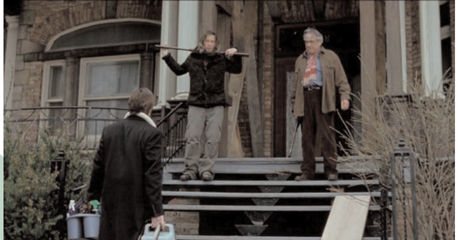
Le père, les fils et la maison