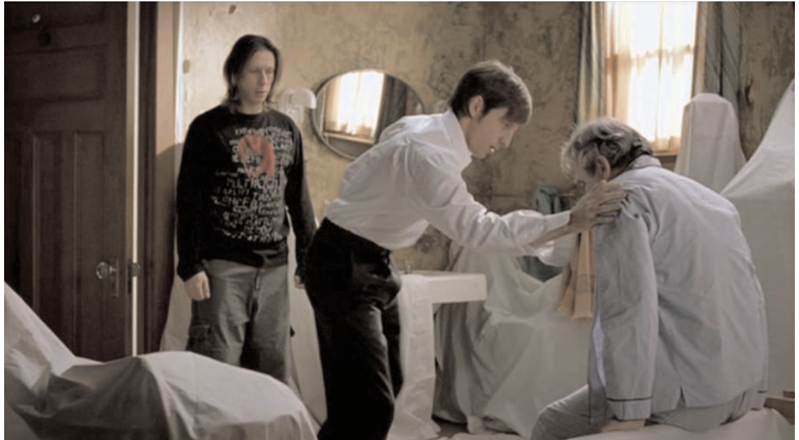
Paul Ahmarani, David La Haye et Raymond Bouchard