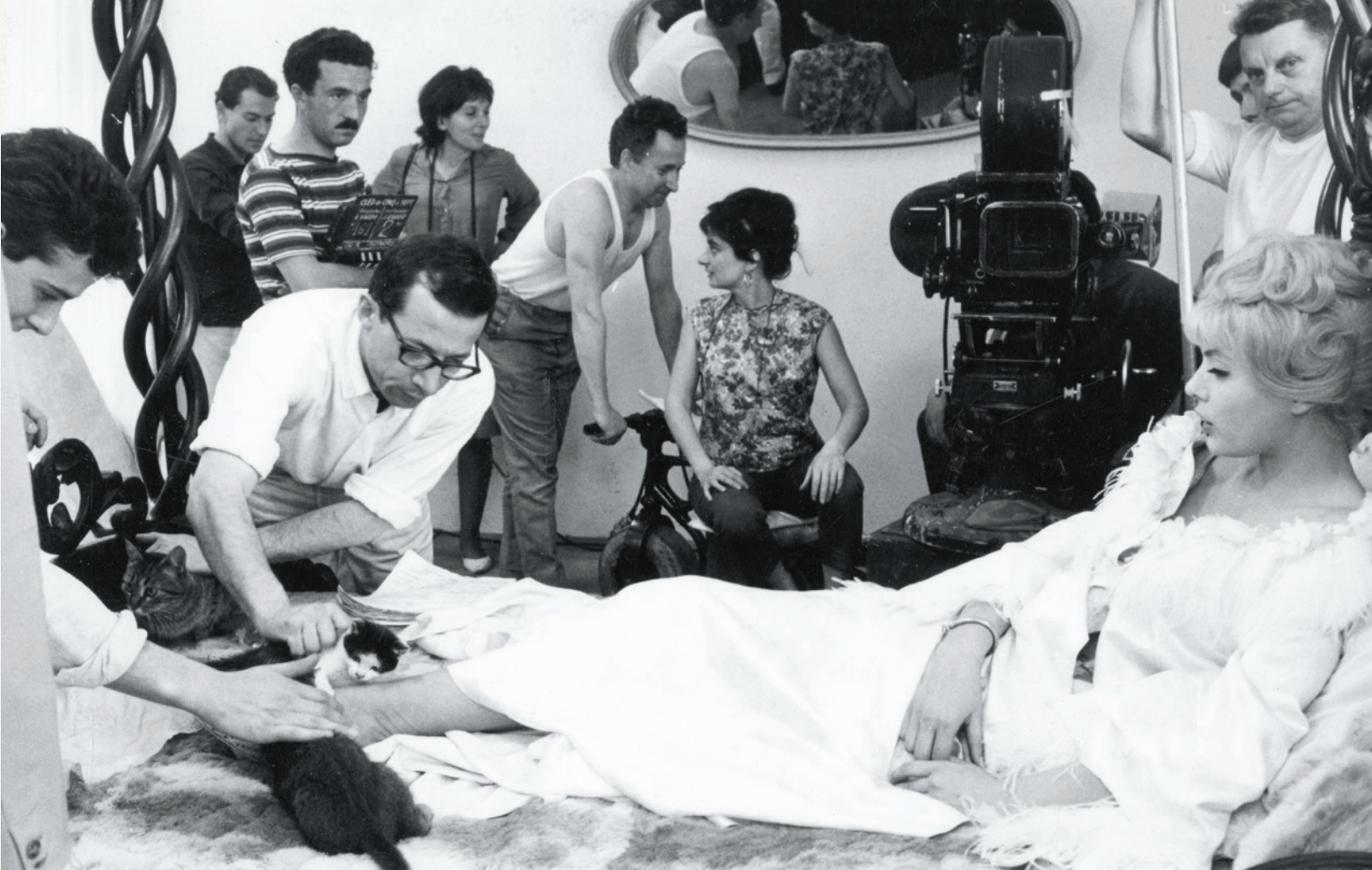
Agnès Varda (assise au centre) lors du tournage

d'ouverture, en dehors des enclaves codifiées, offrant une perspective «documentarissante».